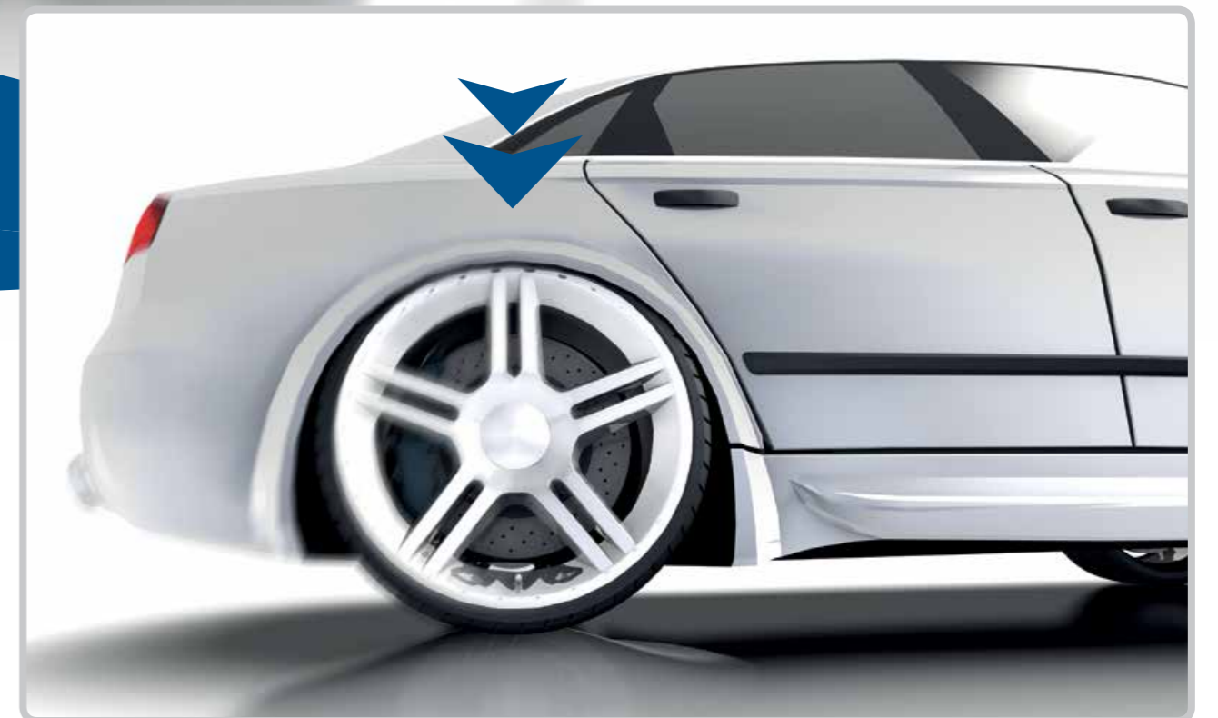
Suspensia atinge punctul cel mai scăzut.