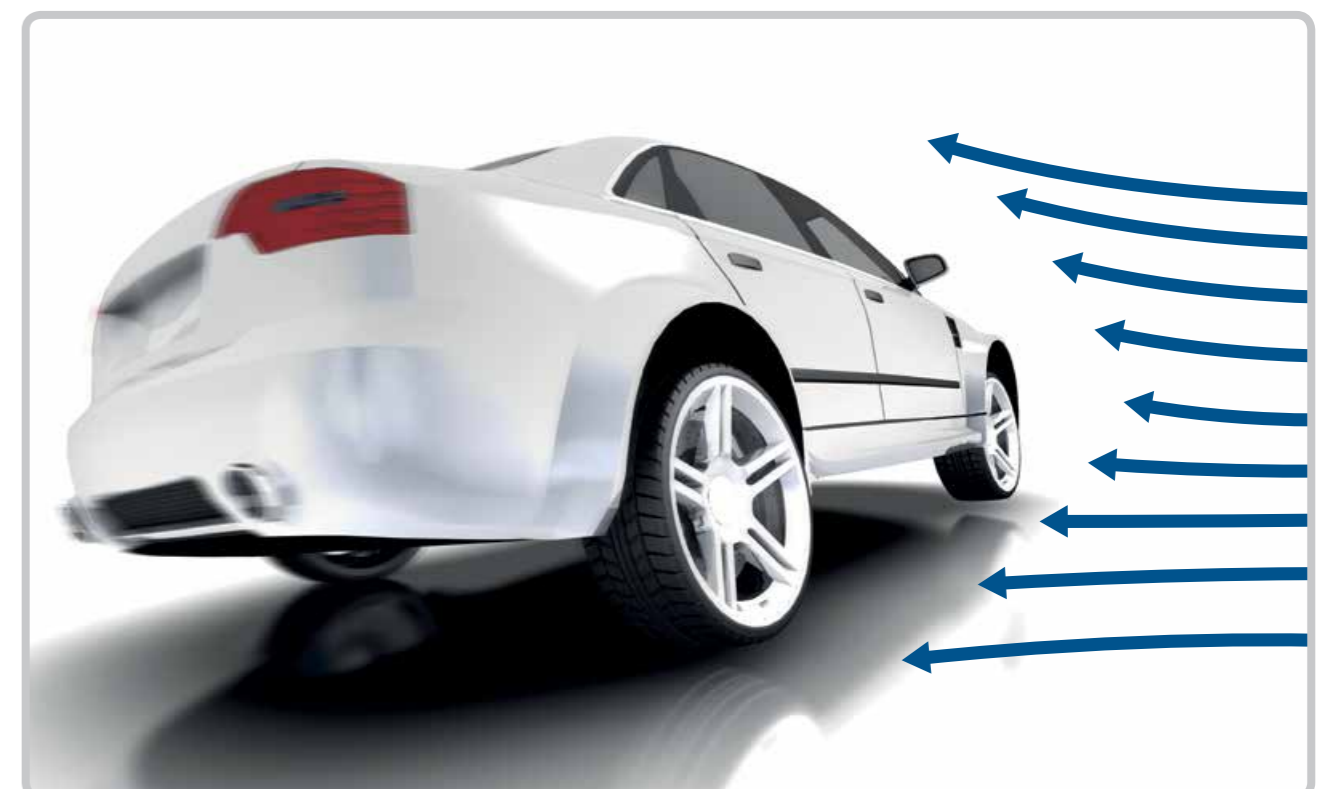
Sensibilitate la vânt lateral