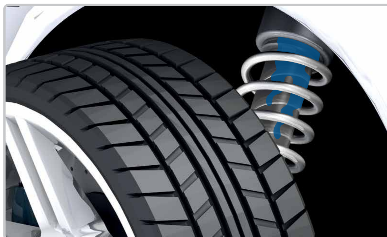
Ulei la amortizor

1. Presiunea aerului este prea mică. | 2. Presiunea aerului este prea mare. | 3. Suspensia roților sau servodirecția este defectuoasă. | 4. Roțile nu sunt echilibrate sau amortizoarele sunt defecte.