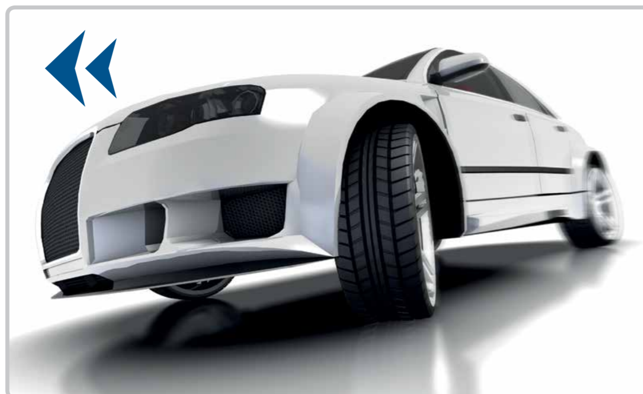
Stabilitate scăzută în curbe