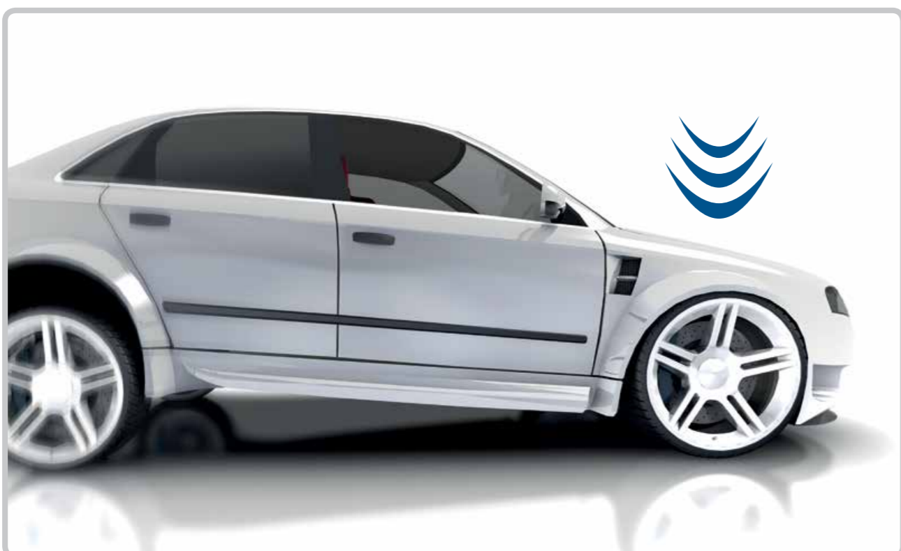
Frânele scad în eficacitate.