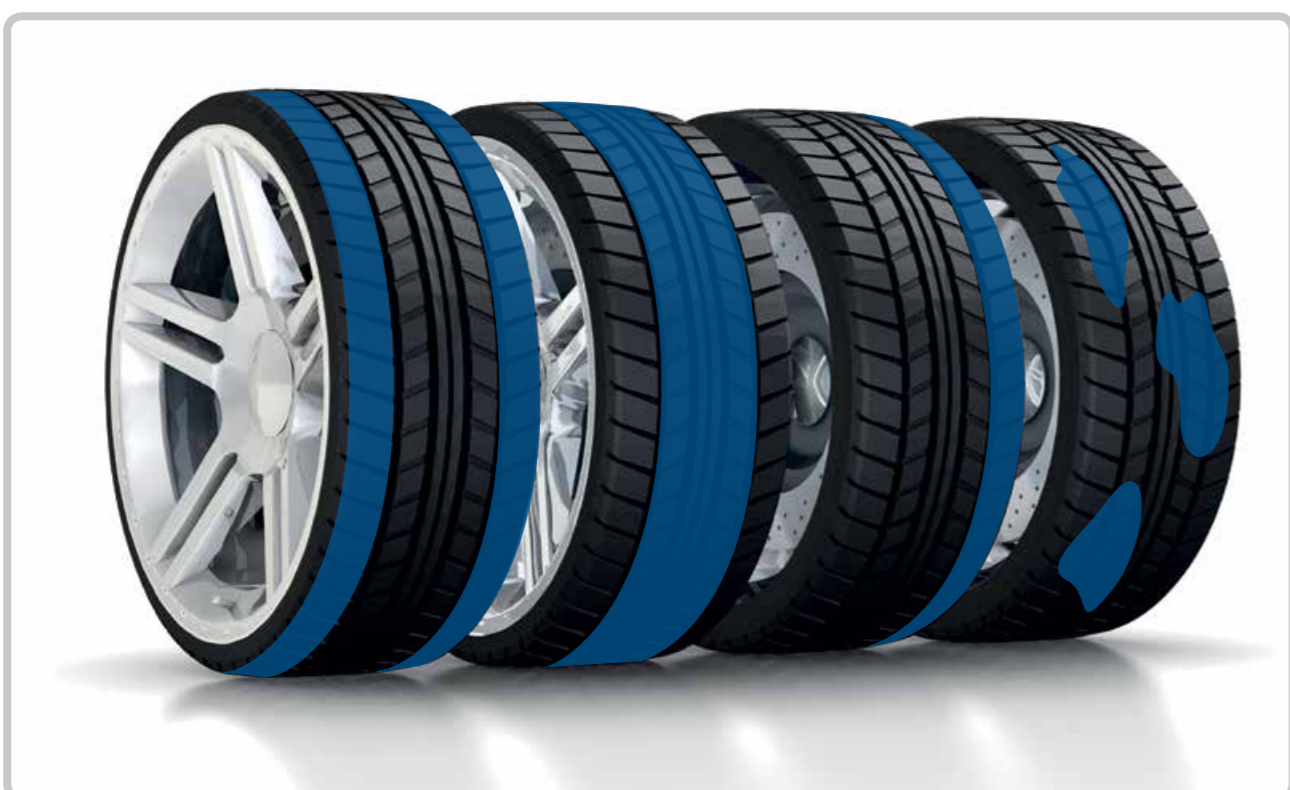
Uzură inegală a cauciucurilor

1. Presiunea aerului este prea mică. | 2. Presiunea aerului este prea mare. | 3. Suspensia roților sau servodirecția este defectuoasă. | 4. Roțile nu sunt echilibrate sau amortizoarele sunt defecte.