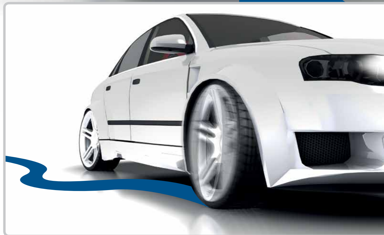
Instabilitate pe traiectorie