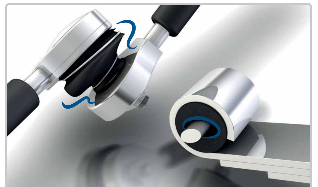
Articulațiile sferice și porțiunile din cauciuc-metal sunt uzate.

(o peliculă subțire de ulei are rolul de a facilita ungerea tijei pistonului)